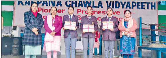
खरखोदा। विजेता विद्यार्थियों को सम्मानित करते हुए स्कूल प्रबंधन।