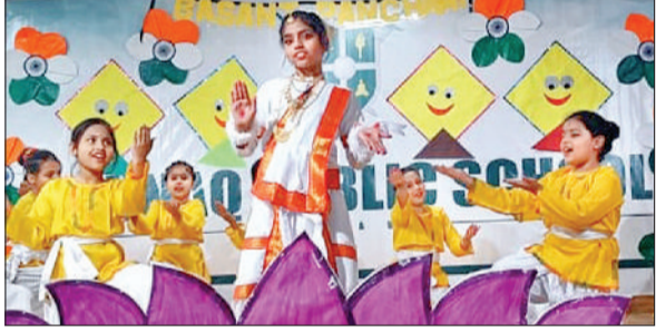
गन्नौर। देशभक्ति से ओतप्रोत कार्यक्रम प्रस्तुत करते छात्र।