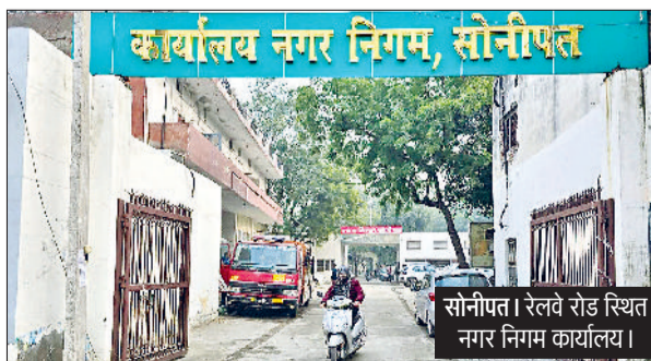
सोनीपत। रेलवे रोड स्थित नगर निगम कार्यालय।

शहर में नगर निगम के अंतर्गत आने वाले विभिन्न कॉलोनियों के लोगों के लिए राहत भरी खबर है। कॉलोनियों में लोगों की ओर से पेयजल व सीवरज व्यवस्था के लिए कराए गए अवैध कनेक्शन अब वैध हो सकेंगे। इसके लिए मकान मालिकों को इन अवैध कनेक्शनों को वैध करवाने के लिए अपने दस्तावेज जमा करवाना अनिवार्य रहेगा। यह प्रक्रिया नगर निगम की ओर से 28 जनवरी बुधवार से ही प्रारंभ की जाएगी। हालांकि चार दिन बाद लोगों को पुनः यह अवसर नहीं मिल पाएगा।