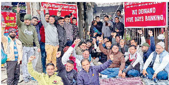
सोनीपत। हिंदू महाविद्यालय के पास पंजाब नेशनल बैंक की मुख्य शाखा के बाहर हड़ताल कर रोष जताने बैंक अधिकारी व कर्मचारी।