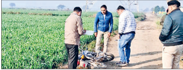
सोनीपत। घटनास्थल पर पहुंचे पुलिस कर्मी जांच करते हुए।