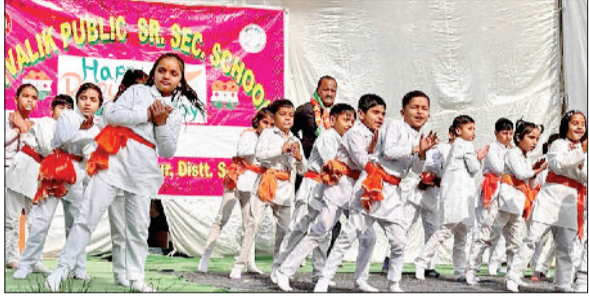
गन्नौर। देश भक्ति से ओतप्रोत कार्यक्रम प्रस्तुत करते छात्र।